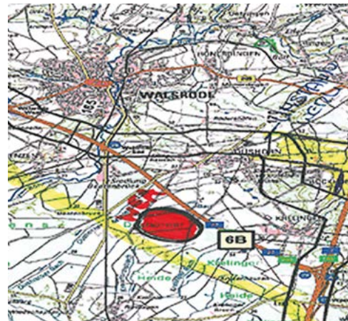
Alternativvorschläge der Bürger werden bei den Infomärkten direkt in Karten eingezeichnet.

Und das Format der Infomärkte kommt an. „Ich finde es gut, dass TenneT auf die Menschen