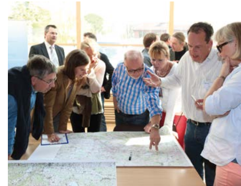
Im direkten Gespräch stellt das SuedLink-Projektteam den vorgeschlagenen Trassenkorridor vor.