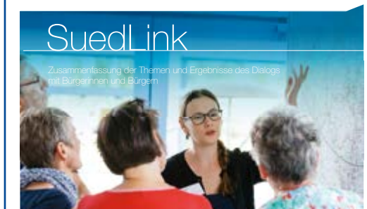
Zusammenfassung der Themen und Ergebnisse des Dialogs mit Bürgerinnen und Bürgern

reichten Hinweise bearbeitet und in das weitere Verfahren integriert werden. Alle Fragen, Hinweise und Anregungen wurden übergeordneten Themenfeldern zugeordnet. Diese sind ebenfalls übersichtlich in der Broschüre aufgelistet und vom Netzbetreiber TenneT mit einer kurzen inhaltlichen Einschätzung versehen.