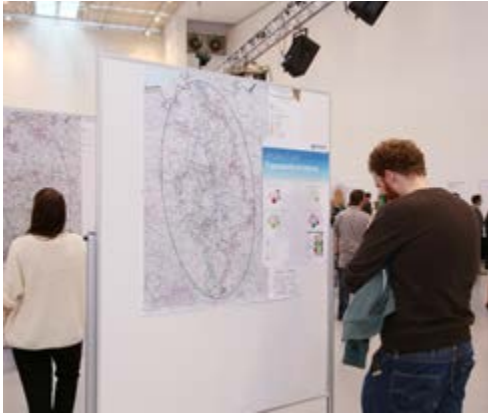
Feedback-Infomarkt in Kassel am 1. Oktober 2014

TenneT präsentierte Ergebnisse der ersten Dialogrunde auf Feedback-Infomärkten – alle Korridorvorschläge werden gleichrangig vor Ort untersucht