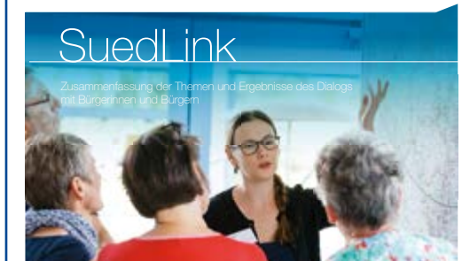
Zusammenfassung der Themen und Ergebnisse des Dialogs mit Bürgerinnen und Bürgern

reichten Hinweise bearbeitet und in das weitere Verfahren integriert werden. Alle Fragen, Hinweise und Anregungen wurden übergeordneten Themenfeldern zugeordnet. Diese sind ebenfalls übersichtlich in der Broschüre aufgelistet und vom Netzbetreiber TenneT mit einer kurzen inhaltlichen Einschätzung versehen.