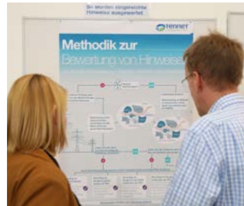
Jeder Hinweis wurde geprüft

prüft und ausgewertet. Denn das lokale Wissen der Hinweisgeber ist wertvoll und hilfreich für die Planungen. Ob ein Hinweis als neuer Trassenkorridorvorschlag in den Antrag aufgenommen wurde, hing zunächst davon ab, ob es sich um einen raumbezogenen Hinweis handelte. Raumbezogen waren Hinweise dann, wenn sie sich auf den Verlauf des vorgeschlagenen Trassenkorridors bezogen oder alternative Korridore beschrieben haben. Hierzu zählten beispielsweise Hinweise zu neu ausgewiesenen Gewerbegebieten oder besonderen Schutzgebietsausweisungen. Rund